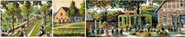
Alte Postkartenmotive aus der Zeit um die Jahrhundertwende: Zeugen eines regen Tourismus in der Wedemark.